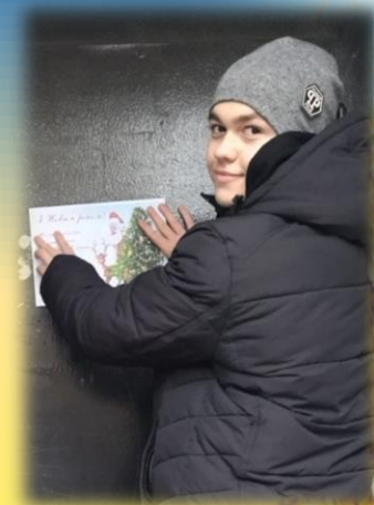
Привітання мешканців району зі святом Нового року