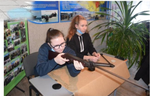
Стрільба з пневматичної зброї