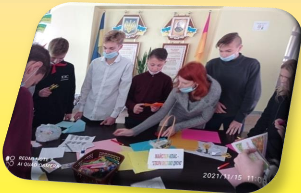
Створення вітальних листівок