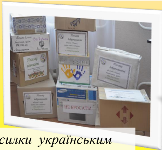
Посилки українським захисникам