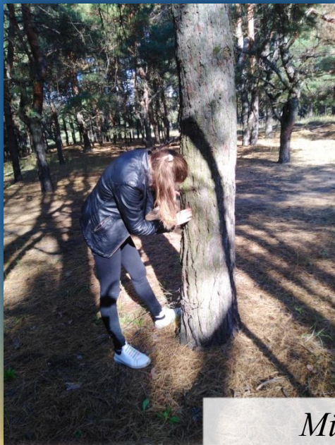
Мій рідний край