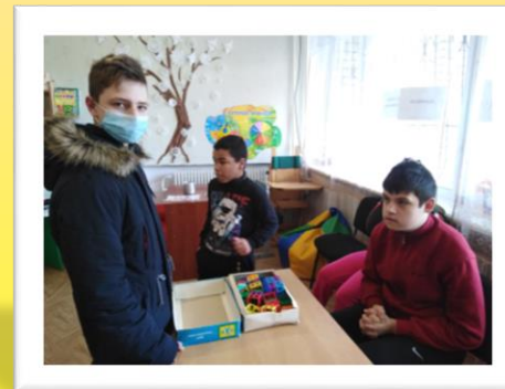
Подарунки дітям з особливими потребами