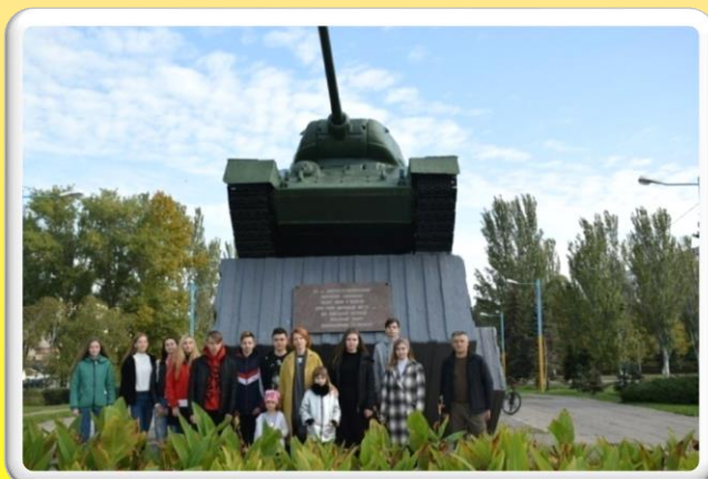
День визволення міста