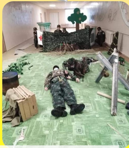
Домедична допомога на полі бою