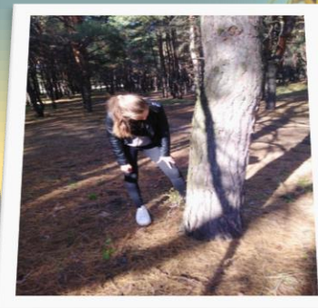
Орієнтування на місцевості